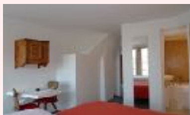
Studio Casa Las Caglias