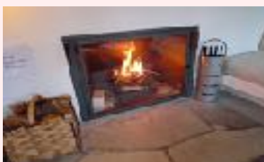
Cheminée Casa Las Caglias

Die Casa Las Caglias ist ein eigenwilliges Apartmenthaus mit fünf Doppelbett-Studios, alle ausgestattet mit Kochnischen, Bad, Dusche und WC. Das Wohnzimmer mit Cheminée und der Fernsehraum steht allen Gästen zur Verfügung, ebenso der Pool im Nachbarhaus Casa Radulff.