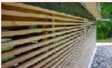
Anbautrakt Casa Las Dunschalas