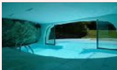
Pool Casa Radulff